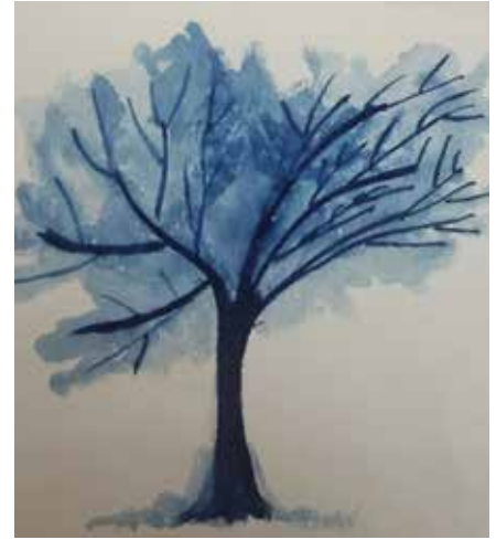
Acuarela: Paola Stefani