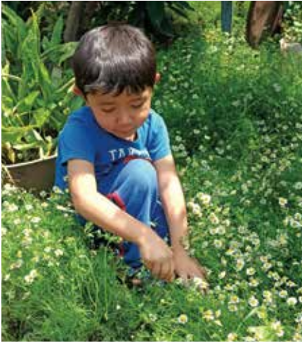
Entre las flores.