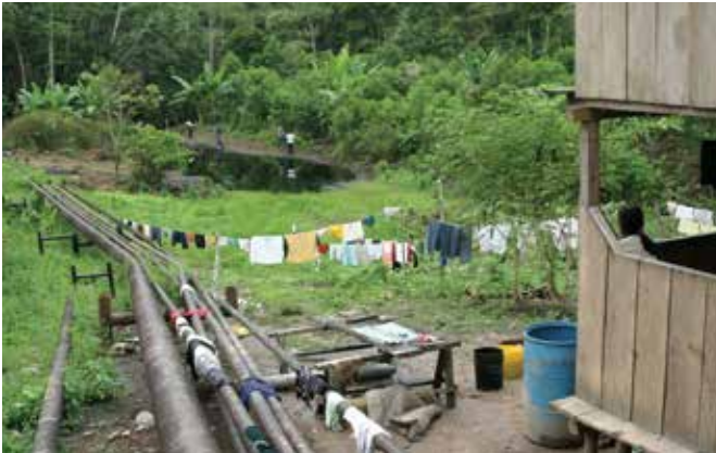
Contigüidad de los ductos con las viviendas amazónicas.