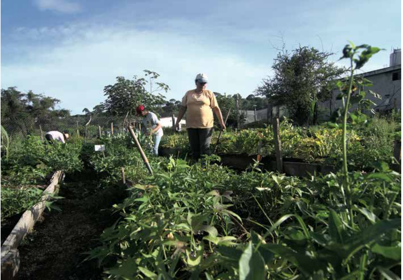
Zapotlán, Jalisco. En la huerta.

Los pesticidas están principalmente en el territorio, en los cuerpos, en el agua, en la fauna silvestre, pero fundamentalmente en los alimentos de toda la sociedad urbana y rural, pues para eso se usan de forma masiva e indiscriminada