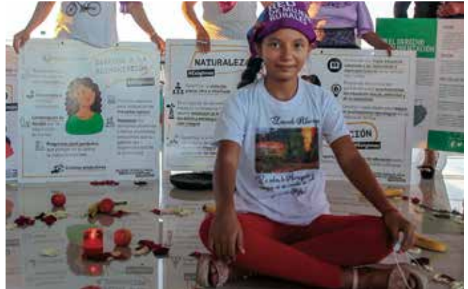
Niñas que impugnan legalmente la falta de cumplimiento de las sentencias de la Corte.

sano y ecológicamente equilibrado, nuestro derecho a la salud y vulnerando también los derechos de la naturaleza.