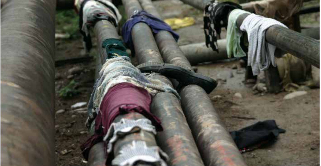
Ductos de petróleo y gas junto a las viviendas en las comunidades amazónicas.