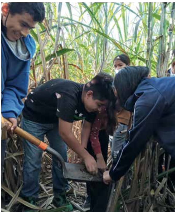
Trabajando la milpa.

muchísimo más lento que en el adulto, su tiempo-ritmo es diferente en todas sus percepciones, pero es tratado con prisa, sin contemplación, en ambos sentidos de la palabra. Y para bebés y niños es “no me entienden”, la comunicación puede dificultarse, ellos tienen que adaptarse a “nuestras maneras”, por eso es importante el tiempo que se pasa con ellos y adaptarnos a su manera, para que se sientan bien y crezcan de manera más armoniosa. Decimos que las y los bebés reciben una sobreestimulación que es física a través de sus sentidos, también emocional-social,