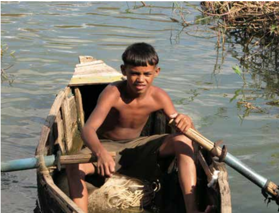
En la Amazonia.