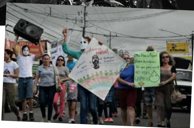
Protesta contra los agrotóxicos en Costa Rica

de agrotóxicos que se comercializan en el país pueden ser analizadas en el Laboratorio Nacional de Aguas (entidad encargada de hacer estos análisis). Es decir, Costa Rica no tiene la capacidad técnica de encontrar 9 de cada 10 venenos que posiblemente estén presentes en el agua que usan las personas para tomar, cocinar, bañarse, etcétera.