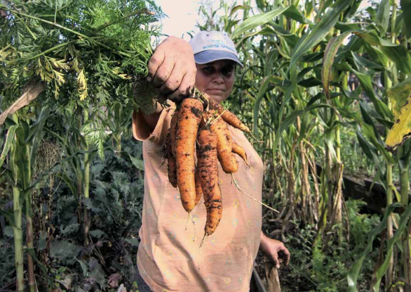
Siembras en Zapotlán, Jalisco.

En la placenta y en la leche materna se han encontrado los químicos, el bisfenol, los pesticidas y muchos más. Eso se sabe y se ha demostrado desde los años ochenta, cuando se demostró que había xenoestrógenos en la leche materna y otras sustancias químicas sintéticas que interfieren con la función normal de las hormonas, y con la salud en general, imagínense ahora, treinta o cuarenta años después.