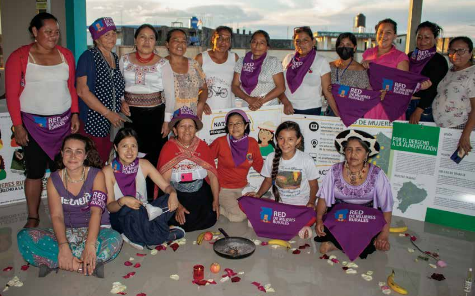
Grupos de mujeres, niñas y jóvenes que protestan e impugnan los mecheros en los territorios amazónicos del Ecuador.