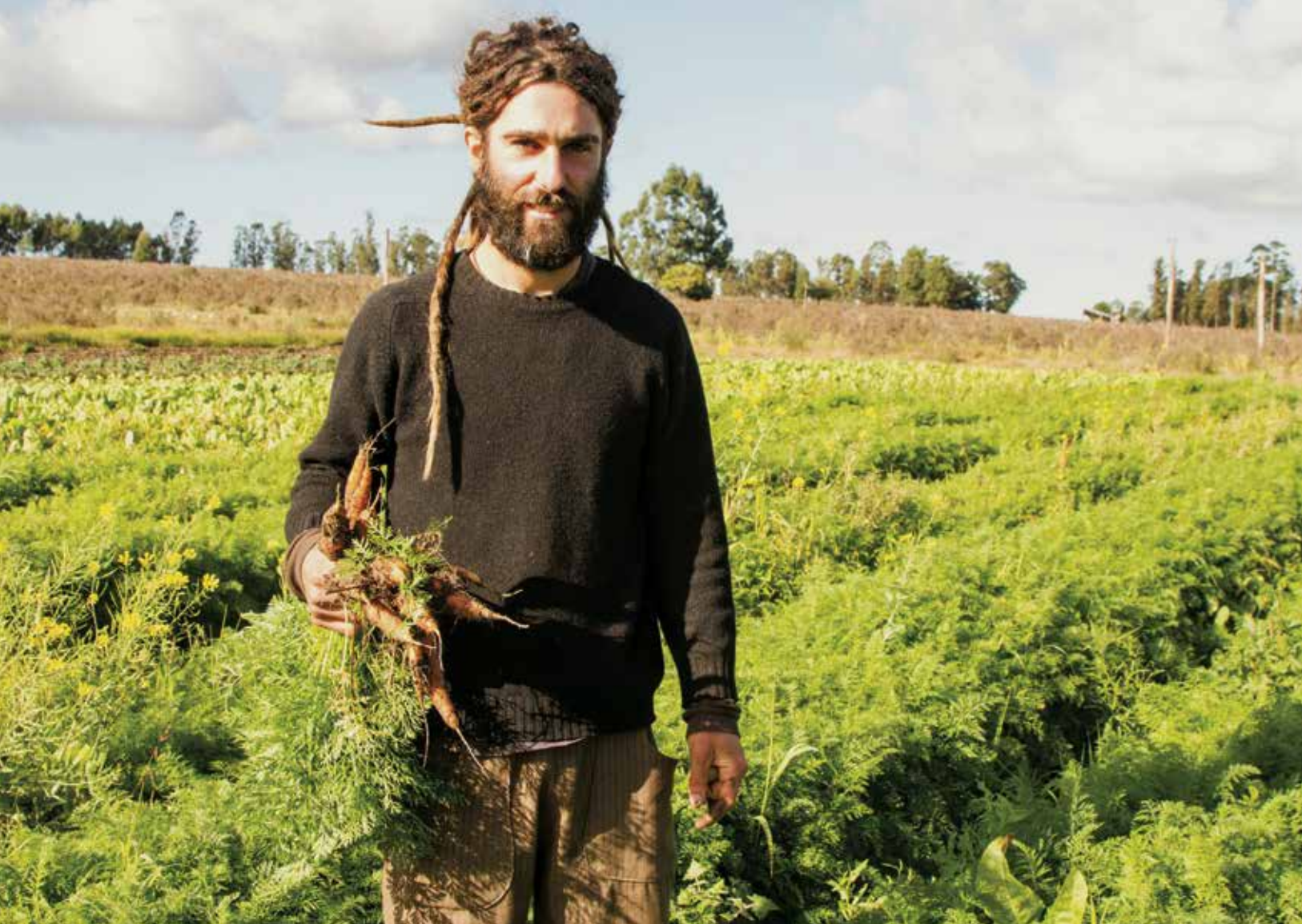
Cosechando zanahoras