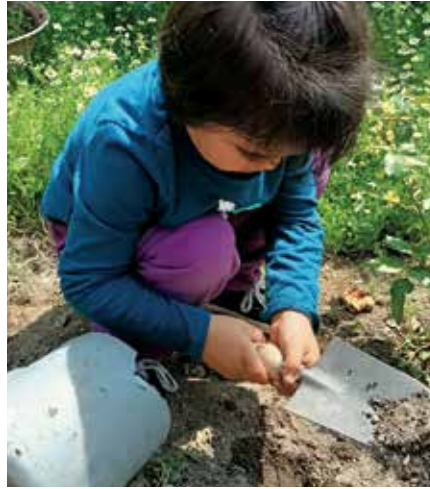
Juntando tierra.